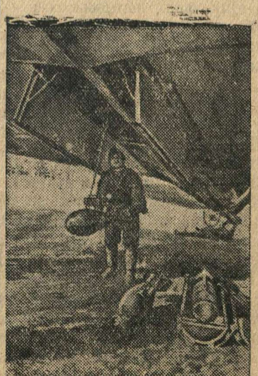
Перед боевым вылетом,