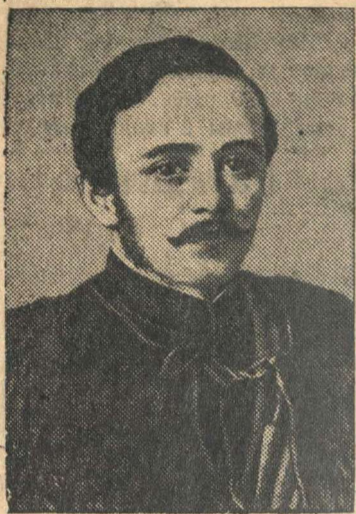
Михаил Юрьевич Лермонтов. Портрет работы художника Астафьева

«Уж мы пойдем ломить стену, Уж постоим мы головою За родину свою!».