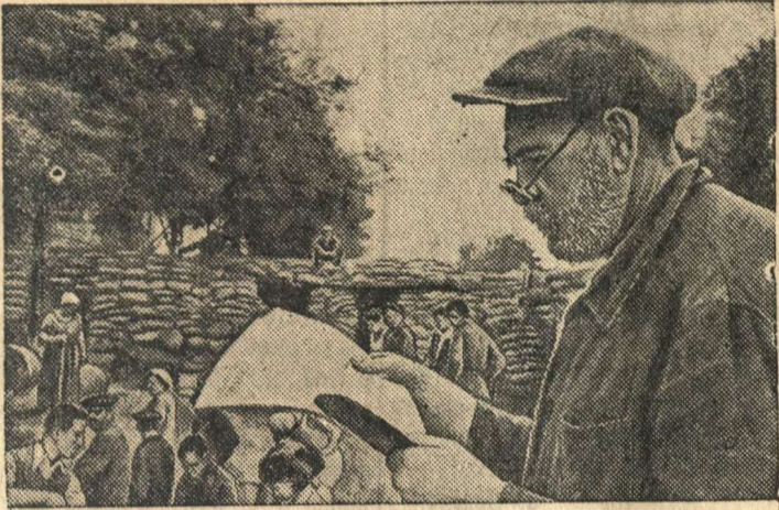
Трудящиеся Одессы готовы отразить любой удар врага.

Население города возводит баррикады. В минуты отдыха рабочих Е. И. Шамов читает свежую газету.