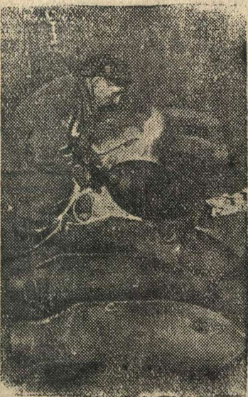
Отделка фугасных авиабомб на Н-ском заводе (Москва).

Действующая Армия (Западный фронт) Отступающие под ударами Красной Армии гитлеровские войска бросают военное имущество в огромном количестве. Это имущество ремонтируется в мастерских и направляется в Действующую Армию.