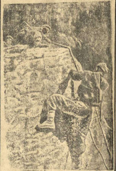
На снимке: Бойцы Н-ского горно-стрелкового отряда, выполняющие боевое задание, разбираются на скалы.