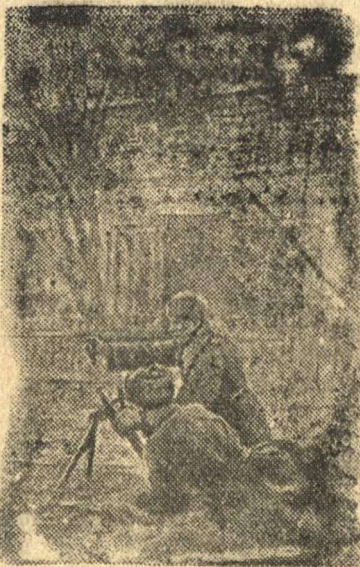
На снимке: Минометчики подразделения старшего лейтенанта Горунова ведут огонь.