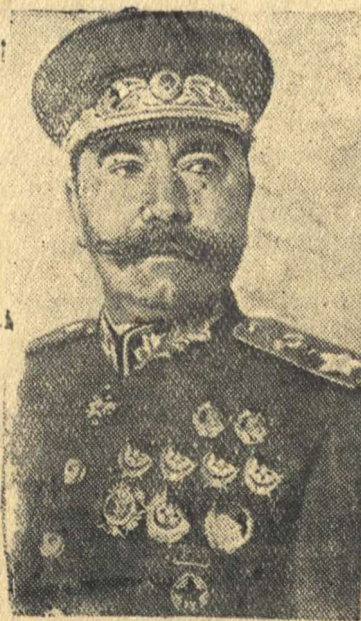
Маршал Советского Союза Семен Михайлович БУДЕННЫЙ.