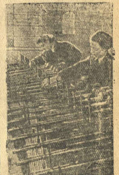
На снимке: Девушки-оружейницы осматривают пулеметы «Виккерс».