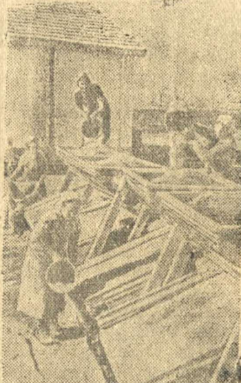
На снимке: Колхозники за очисткой семян сахарной свеклы.

Колхоз имени Сталина (Кантский район, Киргизская ССР).