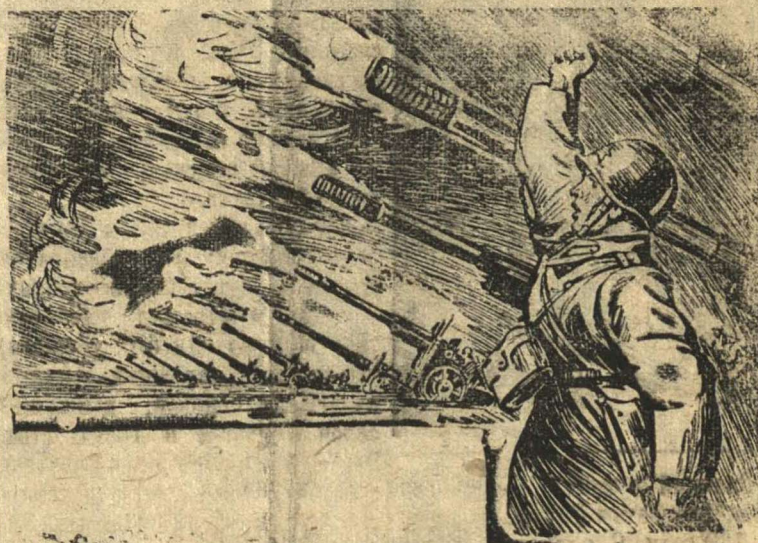
СЛАВА СТАЛИНСКИМ АРТИЛЛЕРИСТАМ — МАСТЕРАМ МОГУЧЕГО СОВЕТСКОГО ОГНЯ! Рисунок художника Г. Балашова.

Где чувство ответственности у руководителей выше указанных колхозов за снабжение страны и Красной Армии картофелем?