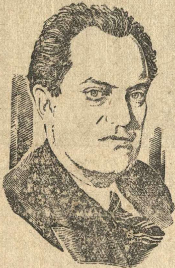
В. В. Куйбышев.

В одной из аякет, заполненной Куйбышевым в период гражданской войны, на вопрос: «Когда