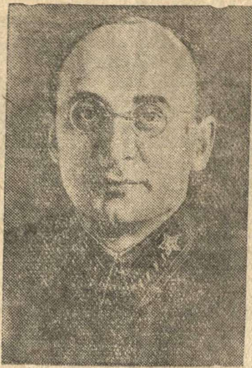
На снимке: тов. Л. П. Берия.