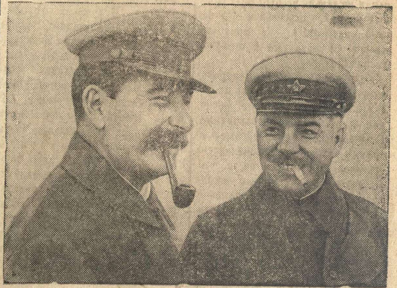
И. В. Сталин и К. Е. Ворошилов (1935 г.).