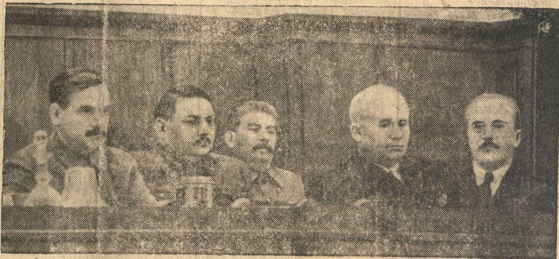
Товарищи А. А. Андреев, А. А. Жданов, И. В. Сталин, Н. С. Хрущев и В. М. Молотов в президиуме конференции.