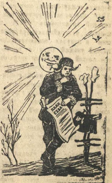
Солнце подводит. — Все бы хорошо, да вот солнце торопится, вылезло из графика! Рис. Теодоровича.