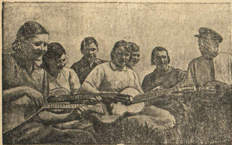
В полевым стане. Трактористы и прицепщики бригады т. Селявки отдыхают во время обеденного перерыва.

Передовая в Сальском районе (Ростовская область) тракторная бригада тов. Селявки (Сальская МТС) систематически перешагивает нормы и экономит горючее. В бригаде культурно и разумно организован отдых.