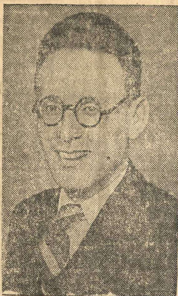
Абсолютный чемпион СССР по шахматам гроссмейстер М. М. Ботвинник

М. Волкова, старшая пионервожатая Илевской НСШ.