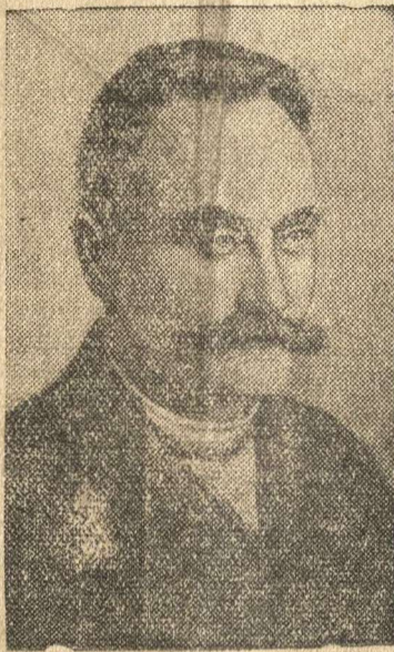
И. Я. Франко.

К 25-летию со дня смерти выдающегося украинского писателя и ученого И. Я. Франко.