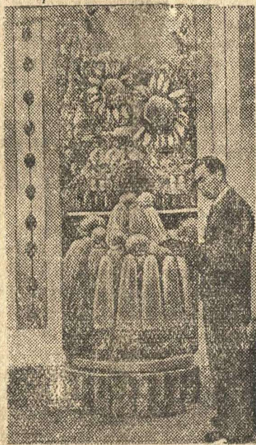
Стэнд технических культур в ввводном зале павильона «Сибирь»

На Всесоюзной сельскохозяйственной выставке.