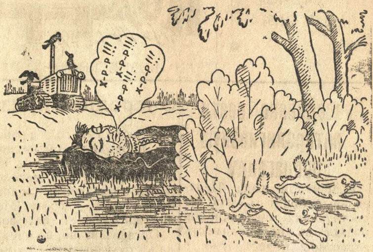
Зайцы: «Спасайся, братцы!.. Трактор заработал»... Рис. В. В. Баби

(Из доклада т. Н. С. Хрущева на совещании партийного, советского и колхозного актива Киевской области).