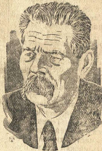
Алексей Максимович Горький.

В 1901 году в знаменитой «Песне о Буревестнике» писатель воспевает «силу гнева, пламя страсти и уверенность в победе» пролетариата. Горький восклицает: «Пусть сильнее грянет буря!»