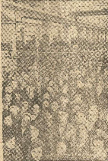
Митинг на Московском заводе «Динамо» имени Кирова в связи с заявлением Заместителя Председателя Совнаркома СССР и Народного Комиссара Иностранных Дел тов. В. М. МОЛОТОВА (22 июня 1941 г.).

Председатель Президиума Верховного Совета СССР М. КАЛИНИН Секретарь Президиума Верховного Совета СССР А. ГОРКИН Москва, Кремль 26 июня 1941 года.