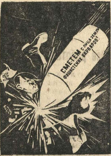
Рисунок художника Н. Долгорукова. (Репродукция с плаката, выпущенного издательством «Искусство»).