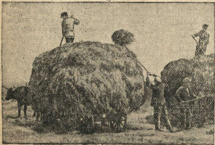
Уборка сена в орденоносном колхозе имени Первого мая (Целинский район, Ростовская область).