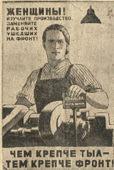
Рисунок художника О. Эйгес (Репродукция с плаката, выпущенного издательством „Искусство“).

В связи с поступившими запросами ВЦСПС разъяснил, что выплата компенсации за неиспользованный отпуск, предусмотренной Указом Президиума Верховного Совета СССР от 26 июня 1941 года „О режиме рабочего времени рабочих и служащих в военное время“, должна производиться в конце последнего месяца рабочего года данного работника. (ТАСС).