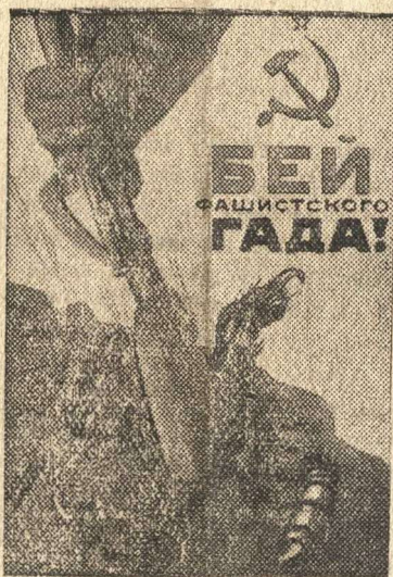
Рисунок художника Кокорекина (Репродукция с плаката, выпущенного издательством "Искусство").

По уполномочию Правительства Его Величества в Соединенном Королевстве—Чрезвычайный и Полномочный Посол Его Величества в СССР— СТАФФОРД КРИППС.