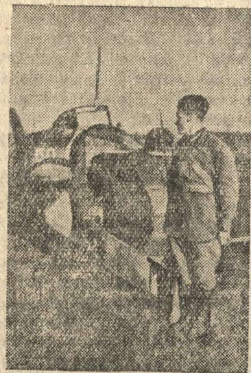
Сбитый нашими доблестными летчиками фашистский бомбардировщик.