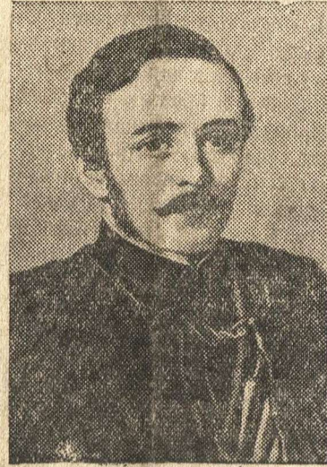
Михаил Юрьевич Лермонтов. Портрет работы художника Астафьева

К 100-летию со дня смерти М. Ю. Лермонтова (27 июля 1941 г.)