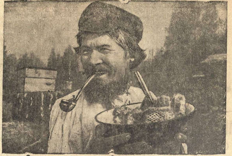
На пасеке колхоза имени Крупской, Ибресинского района Чувашской АССР.