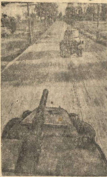
Разведывательный отряд бронемашин.