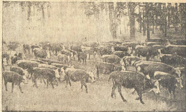
Колхозники угоняют скот из села, занимаемого врагом.