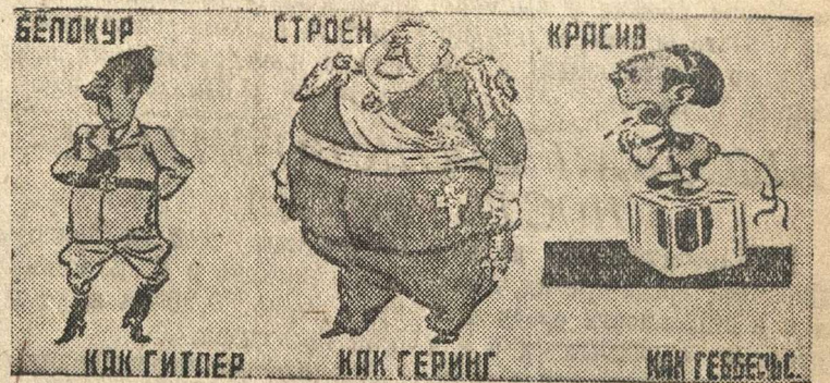
Рисунок Б. Ефимова (Окно ТАСС № 22).

Согласно фашистской расовой теории истинный ариец должен быть: