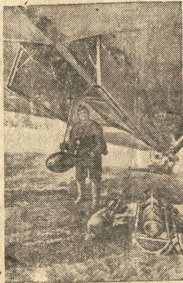
Перед боевым вылетом.