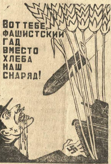
Плакат работы художника М. Катизарьяна. ТАСС.