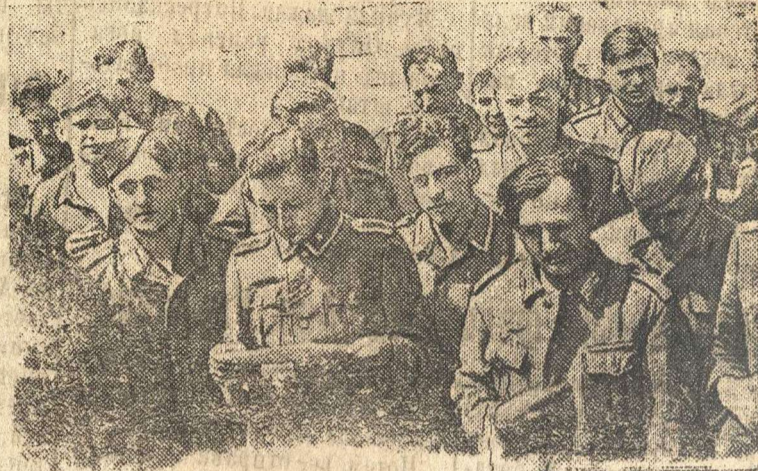
Группа пленных немцев.