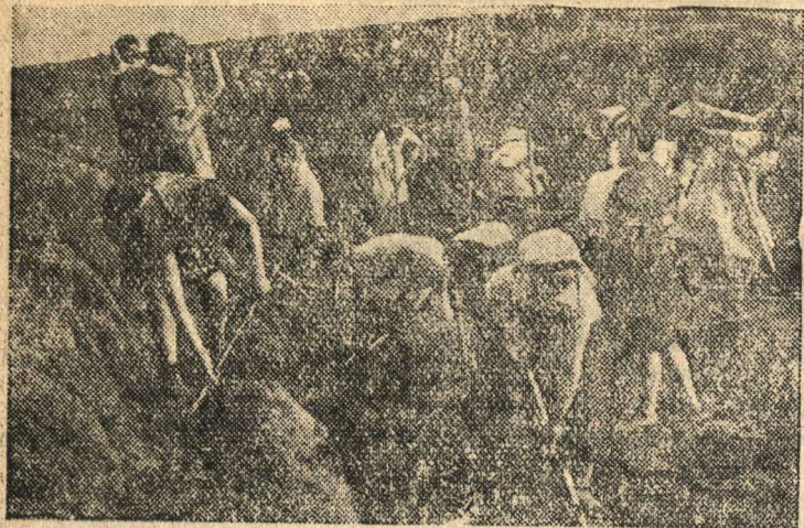
В прифронтовой полосе.