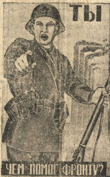
Рисунок художника Моор. (Репродукция с плаката, выпускаемого издательством «Искусство».)