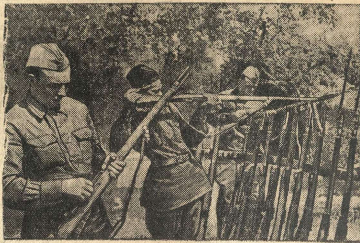
Ополченцы получили боевое оружие.