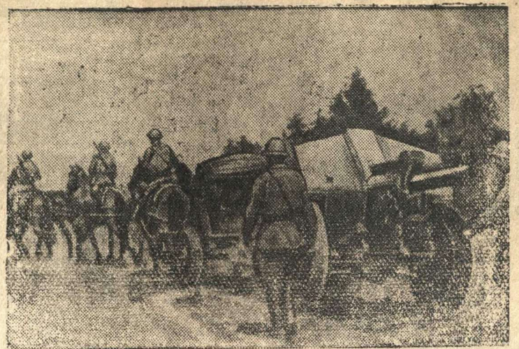
Советские артиллеристы продвигаются на передовые позиции

АНКАРА, 23 сентября. (ТАСС). В журналистских кругах передают, что немецкая подводная лодка с провокационной целью потопила в Черном море болгарский пароход. Немцы хотят приписать это потопление советскому флоту.