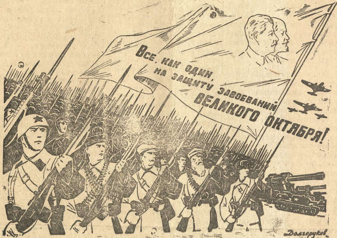
Рисунок художника Долгорукова.

Отстоим великие завоевания Октября. Всеми силами поможем Красной Армии быстрее разгромить и уничтожить ненавистного врага, чтобы навсегда обеспечить свободную и счастливую жизнь на нашей земле.