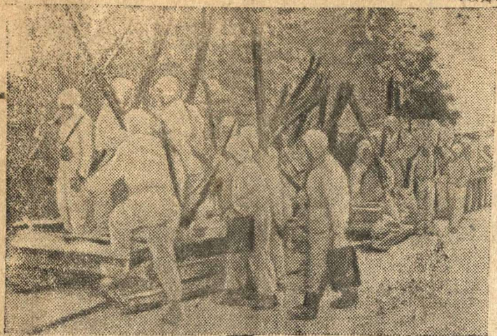
Бойцы Н-ской части отправляются на передовые позиции.