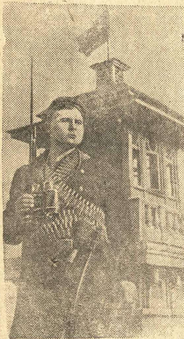
Краснофлотский пост воздушного наблюдения на крыше одного из домов.