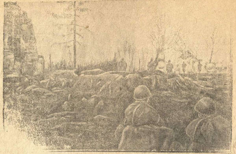
На снимке: Бойцы атакуют населенный пункт М.