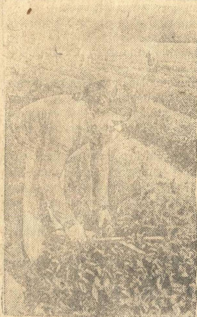
Тов. Тарга Дарико — сталанин на колхоза имени Берия (Гудатский район, Аджарская АССР) выполняет норму по формовке чайного куста на 250—300 проц.