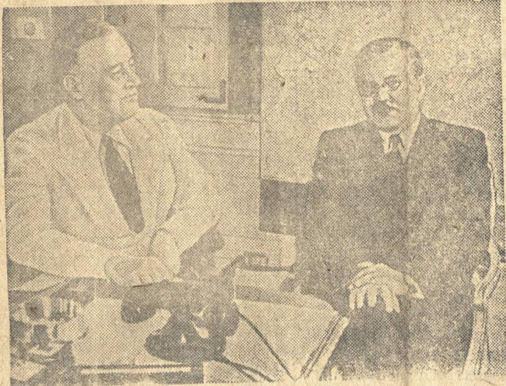
Президент США Франклин Д. Рузвельт и Народный Комиссар Иностранных Дел В. М. Молотов.

К пребыванию тов. В.М. Молотова в Вашингтоне.