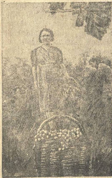
На снимке. Уборка винограда на участке совхоза.

В этом году совхоз имени Ильича (Сухумский район, Абхазская АССР), даст стране около 150 тонн винограда разных сортов. В совхозе уже началась уборка. Первая тонна собранного винограда была отправлена в госпитали.