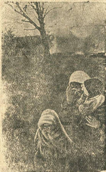
В селе Серболово Ленинградской обл., сожженной гитлеровскими захватчиками.