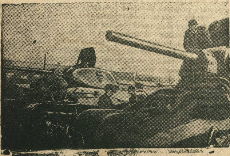
Последняя проверка танков на Н-ском танковом заводе перед отправкой на фронт.