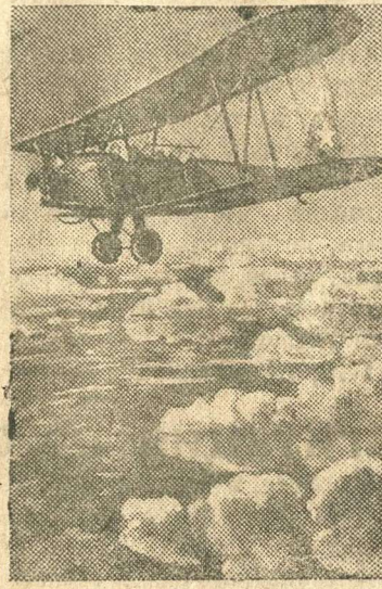
На снимке: Связной самолет Н-ской авиачасти, скрываясь за облаками, летит на выполнение задания в тыл врага.

В течение 11 декабря наши войска в районе Сталинграда и на Центральном фронте продолжали вести наступательные бои на прежних направлениях.