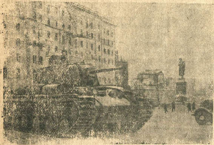
Москва в дни немецко-фашистского наступления. На снимке: Тяжелые танки проходят по площади Пушкина, направляясь на фронт.

К ГОДОВЩИНЕ РАЗГРОМА НЕМЦЕВ ПОД МОСКВОЙ. Год назад Красная Армия в ожесточенных боях под Москвой разбила немецко-фашистские войска и отбросила их от столицы.