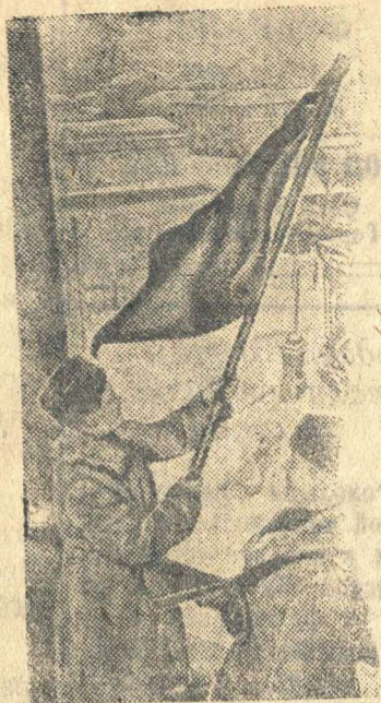
На снимке: Красное Знамя вновь развевается над Шлиссельбургом.