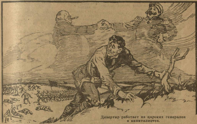
Дезертир работает на царских генералов и капиталистов.