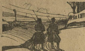
К рассказу "Дезертир".

Из-за церковной ограды в снежную даль поля ползет темная лавина. Скрипит снег, гулко разносятся в морозной тишине отдель-