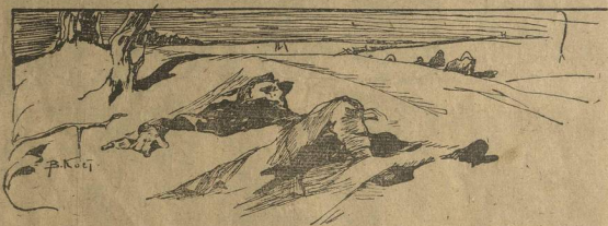
К рассказу „Дезертир“.

Отец подошел к нему вплотную и поднял кулак.