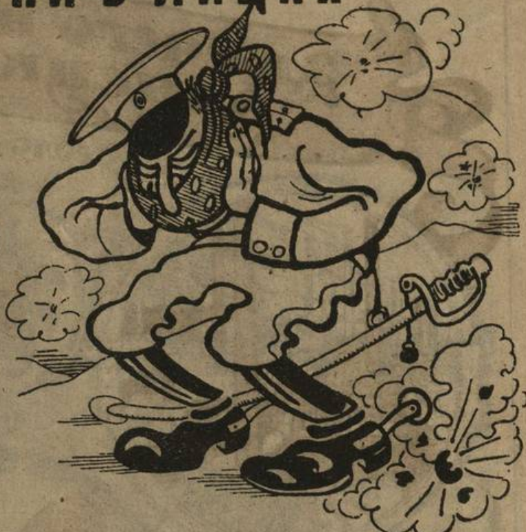
БЕЛОГВАРДЕЦ:—«Голова твоя удалая, долго-ль буду тебя я носить»