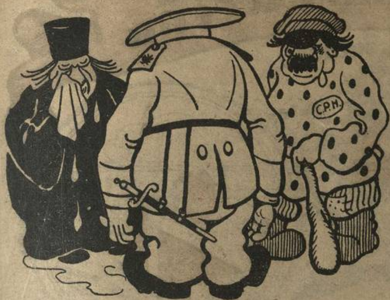
КОЛЧАК:—«Последний монешный денечек гуляю с вами я, друзья»