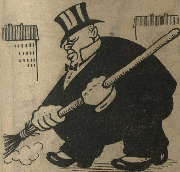
БУРЖУА:—«Бывали дни веселья»