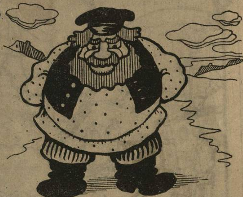
КУЛАК—«Бродяга судьбу проклиная»