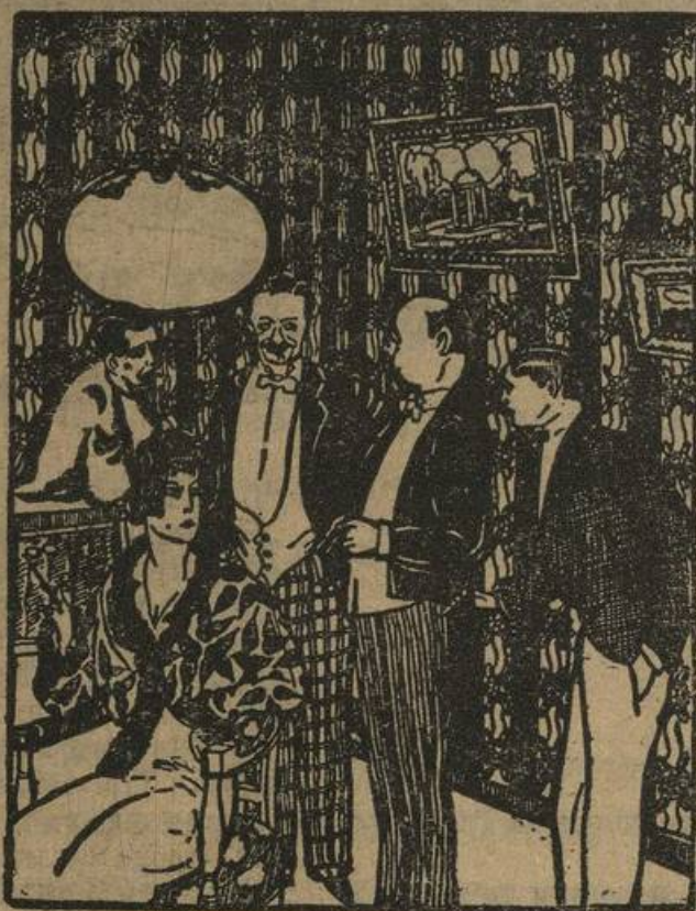
— Разрешите, ваше сиятельство, представить...