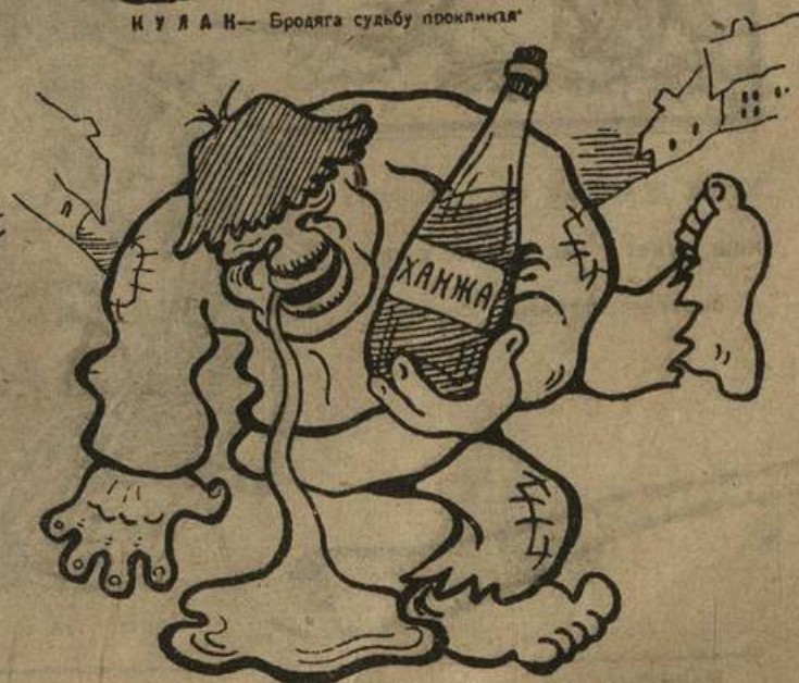
ТНП:—«Зачем ты безумная губишь того кто увлекся тобой»