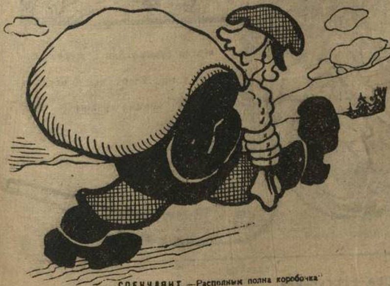
СПЕНУАНТ:—«Располним полна коробочка»