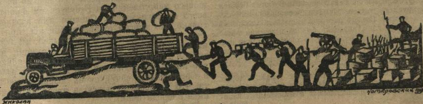
Все для фронта.