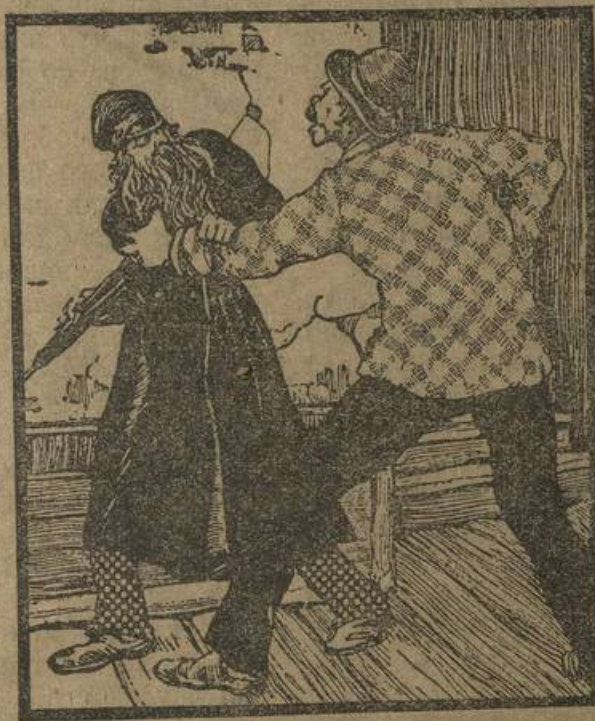
Стой!.. Ни с места, жид!.. — закричал сыщик.

И взгляд его единственного глаза грустно, почти ничего не видя перед собой, задумчиво скользил по быстро бегущим орошенным дождем травам.