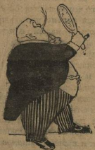
3. Вырядится во фран, орилливанты; нрфяртит усы.