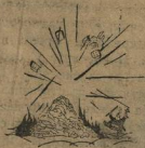
5. Взорвет несколько городов, и примеру таних, как Киева, Борисов: навалит пирамиды трупов невинных мирных жителей.