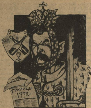
Пан Пилсудский—король Польши 1772 г. Границы его, нарисовала у него на физиономии Красная Армия