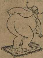
1. Польские паны очень культурные люди. Отрастит себ этот „культурный“ пан пуз