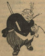
4. Возьмет под мышну лим-фомку, динамит, топор.