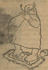
2. Наденет крахмале